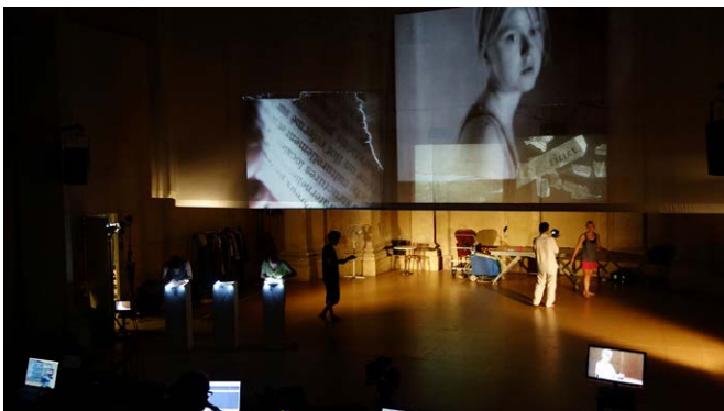
Zeus séduit Europa