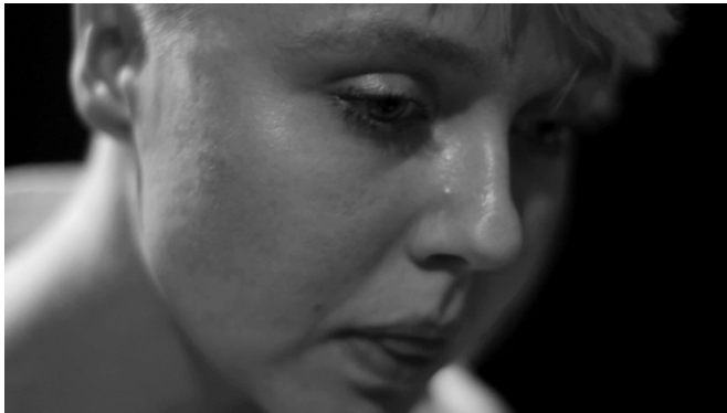
Europa / Isadora