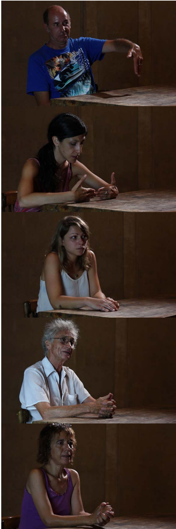
Images du film d'Alwynne Pritchard : I saw something – août 2013 Marseille